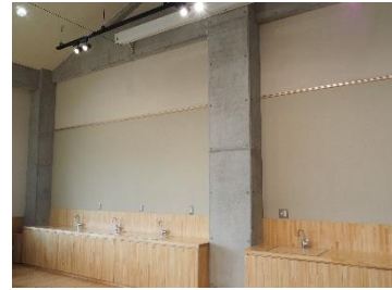
企画・展示コーナー